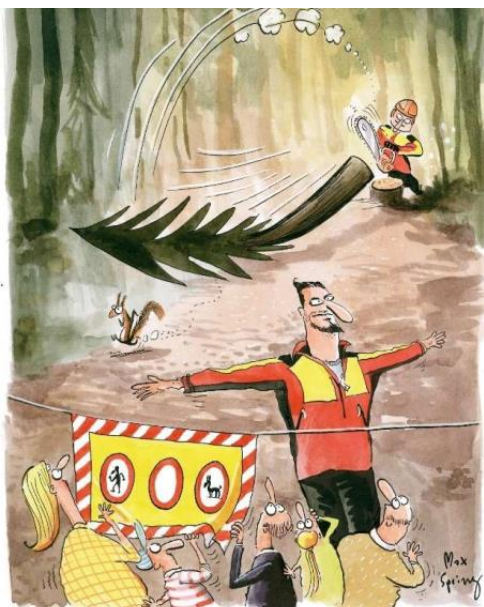
Illustration: Max Spring,

Waldknigge der Arbeitsgemeinschaft für den Wald